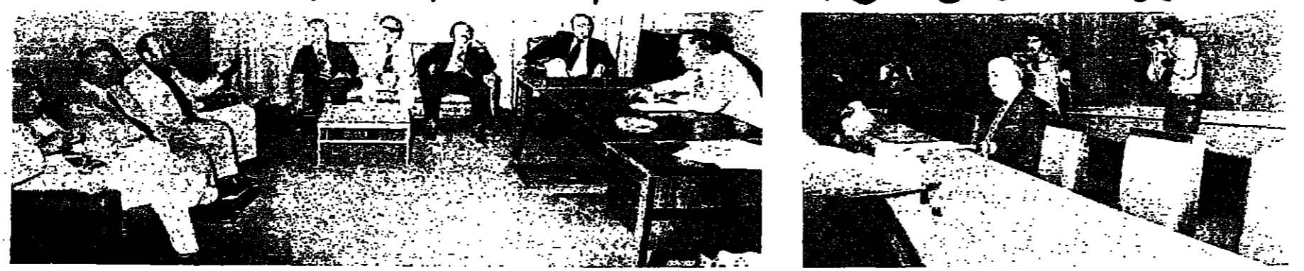
لقاء بين عدد من النواب في إحدى غرف المجلس